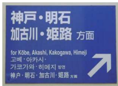
⑨ Indicação em multi-linguas; A quem essa placa é útil?