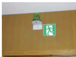
② Lâmpada Verde: Para que está instalada esta lâmpada ?