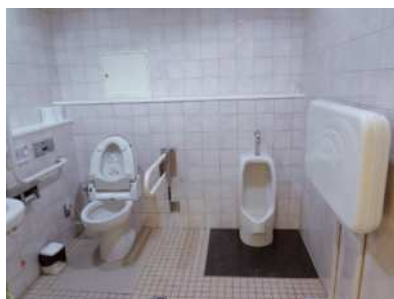
⑧ Toaletes; A quem essa toaletes é fácil de usar?