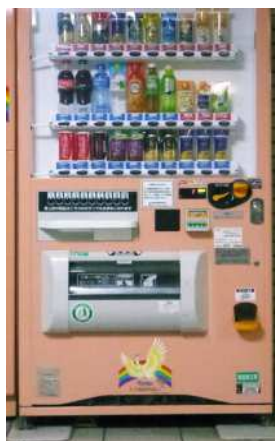
① Máquina de Venda Automática de Bebidas; Quais são as diferenças?:

Ao nosso redor existem muitas coisas práticas, que foram feitas pensando na gente. Vamos procurar onde e que tipo de coisas são estas.