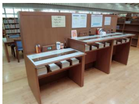
⑥ Balcão para preencher documentos: Por que tem altura diferente?