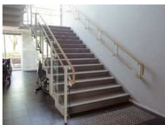
③ Corrimão; Por que tem dois corrimãos instalados em níveis diferentes?..