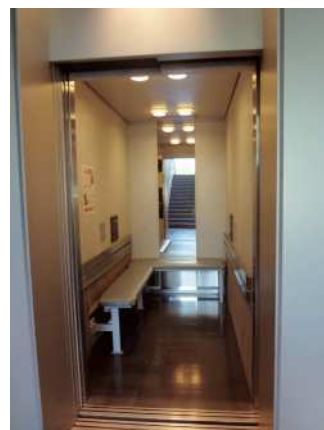
④ Elevador: Quais são as diferenças?